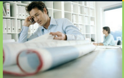
Architekten - Ingenieure - Dienstleister