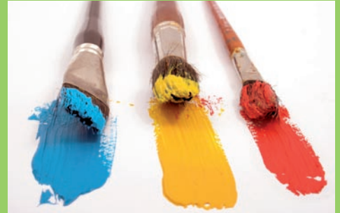
Copyshops - Reprographen