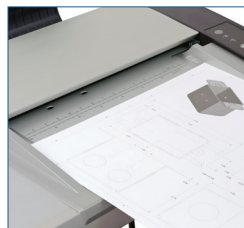
Unterstützen Sie Ihre Dokumente mit Papierführungsschienen