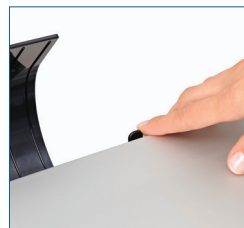
Passen Sie den Druck mühelos an, um empfindliche Dokumente zu schützen