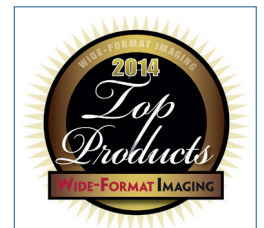
Contex HD Ultra erhält zum dritten Mal hintereinander die Auszeichnung als bester Großformatscanner