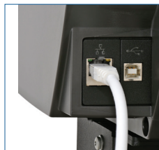
Branchenweit schnellste Transferrate mit Gigabit-Ethernet und xDTR2