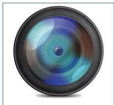
Contex CCD mit ALE gewährleistet eine Präzision von 0,1 % Genauigkeit

Die HD Ultra-Scanner sind optimal für Kunden, die einen hohen Durchsatz an Dokumenten, eine hohe Flexibilität und unübertroffene Leistung wünschen.