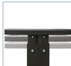
Höhenverstellbarer Standfuß für optimale Ergonomie