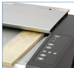
Dicke Vorlagen scannen mit der automatischen Anpassung an die Dokumentendicke (ATAC)